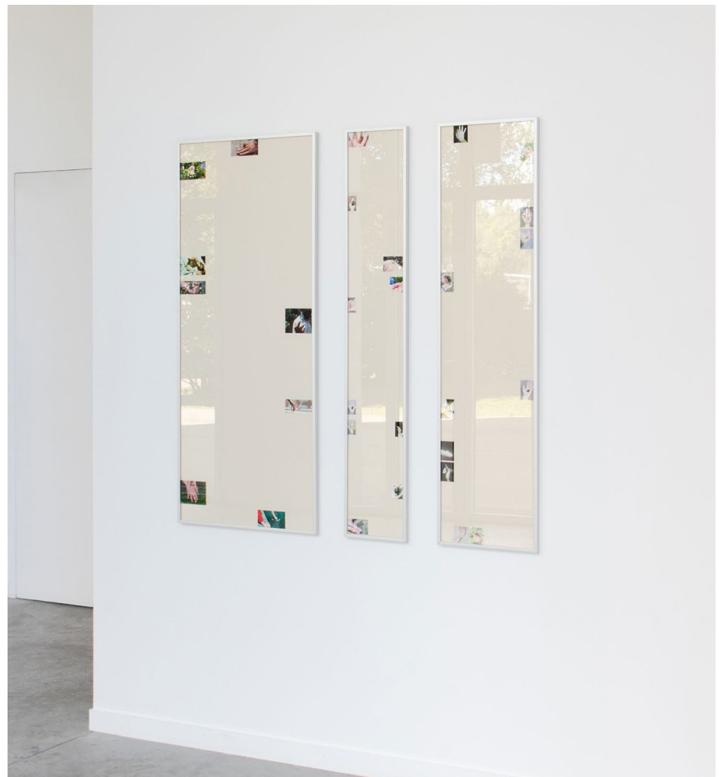
Philippe, 2024 ← Impression. 137,5 x 92 cm

Photographie de la série Mains-bêtes . Une jeune perruche à collier se loge dans la large paume de Philippe, éleveur d'oiseaux dans la région de Nantes.