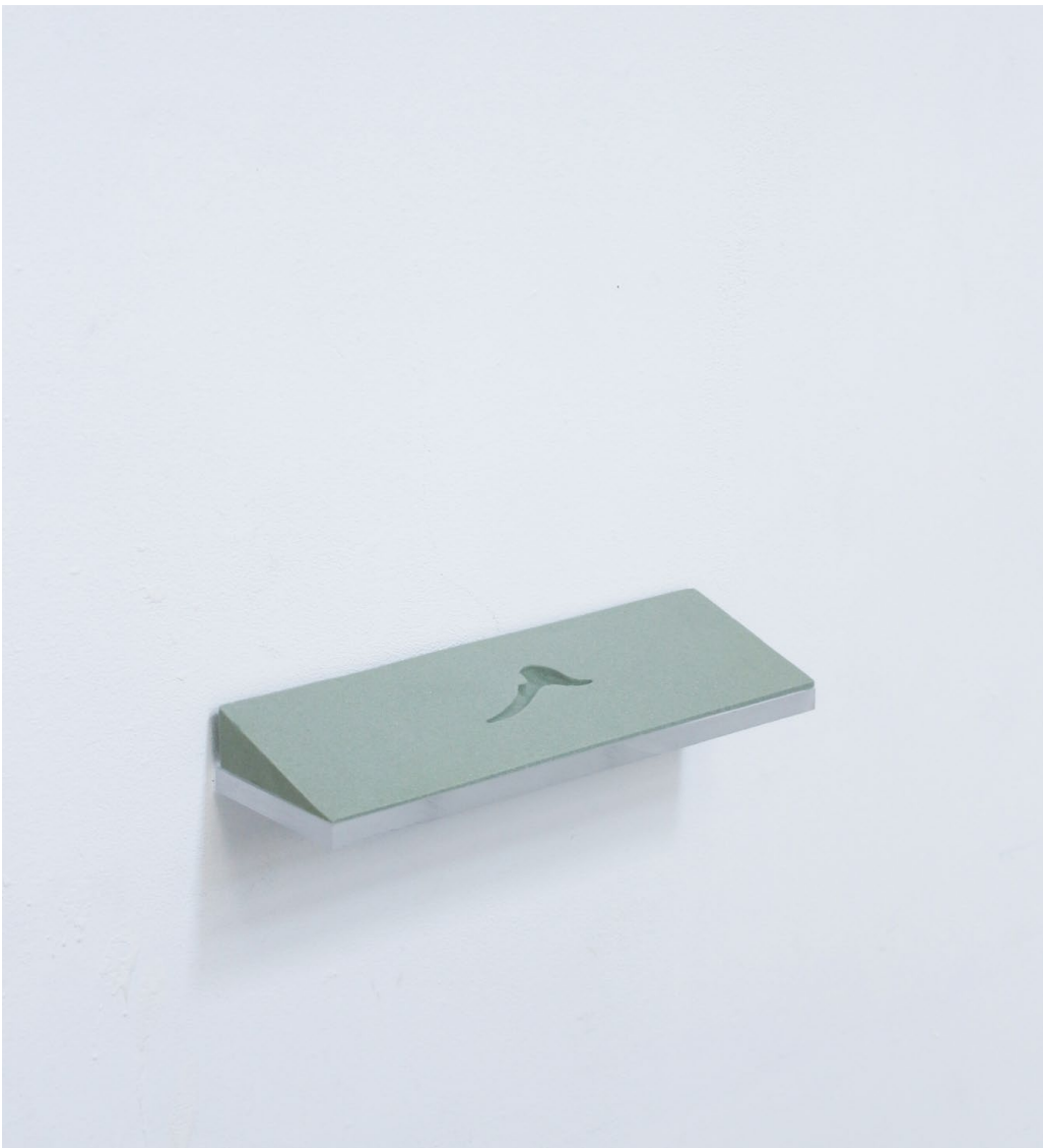
forme ôtée pour étude 01, 2021 ↑ mousse polyuréthane, plexiglass. 20,5x2,4x12 cm.

Forme découpée et taillée inspirée d'un des socles vides des vitrines de la Galerie de Paléontologie et d'Anatomie Comparée lorsqu'un ossement est récupéré par des scientifiques afin de l'étudier.