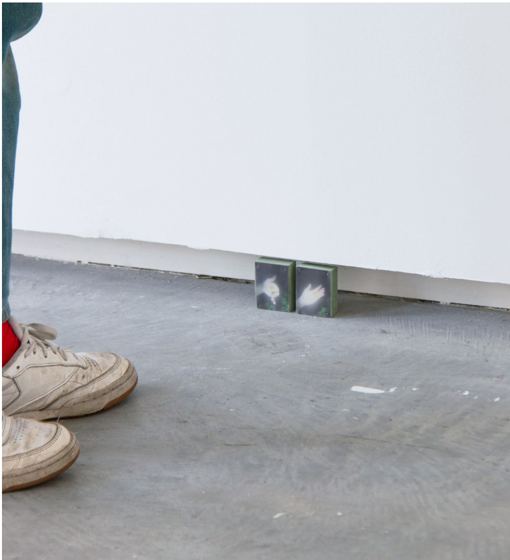
Main-Dendropsophus minutus, 2024 ↑ médium hydrofuge, impressions, acier, plastique. 10 x 6 x 2 cm