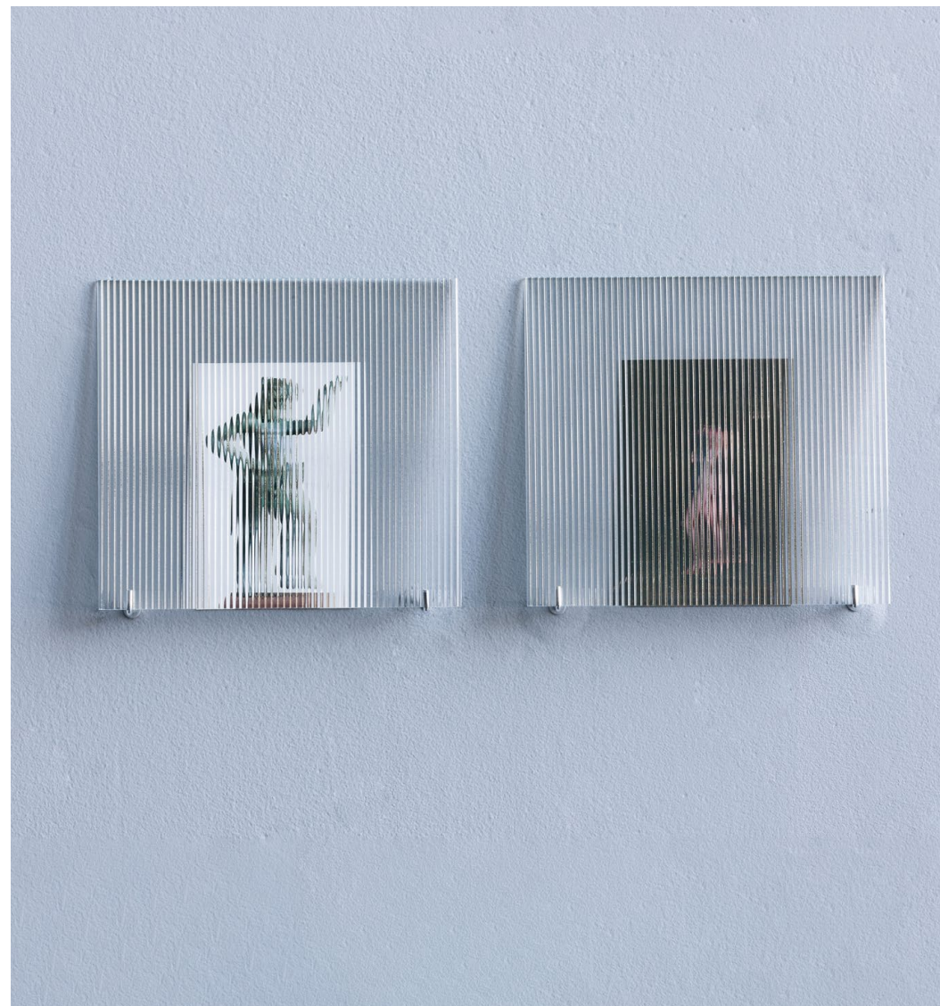
étendue 02 - satyres, 2023 (vue 2) ↑ verre estriado, tirage photographique, carte postale.

Reproduction par le modelage d'une pièce antique de la collection du musée d'archéologie d'Athènes.