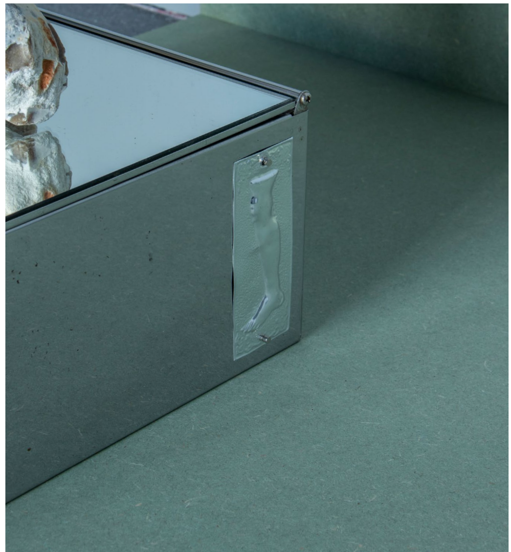
étendue 02 - cuisse et jambes, 2023 (vue 5) ← medium hydrofuge, pierre, armoire à pharmacie, tirage dos bleu, plâtre, exvoto en aluminium

Reproduction en plâtre d'une sculpture antique d'une cuisse. L'image au mur est un agrandissement d'une photographie trouvée dans un cartel explicatif du musée d'archéologie d'Athènes.