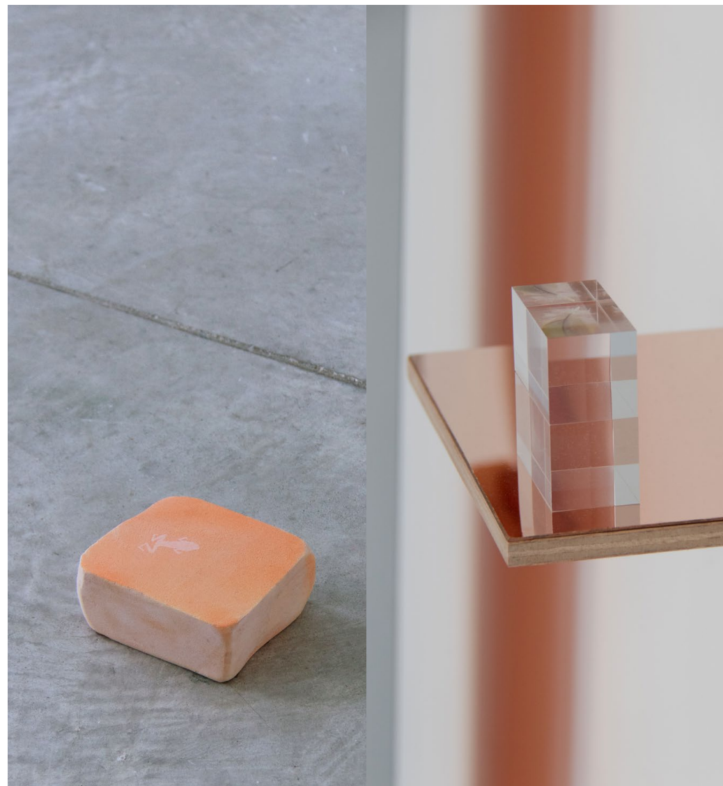
systèmes complexes, 2024 ← étendue ramper

Cette installation mime les collections du muséum d'histoire naturelle de la ville de Nantes, interrogeant la fascination entomophile des scientifiques envoyés par les puissances européennes et venus étudier les écosystèmes de pays colonisés.