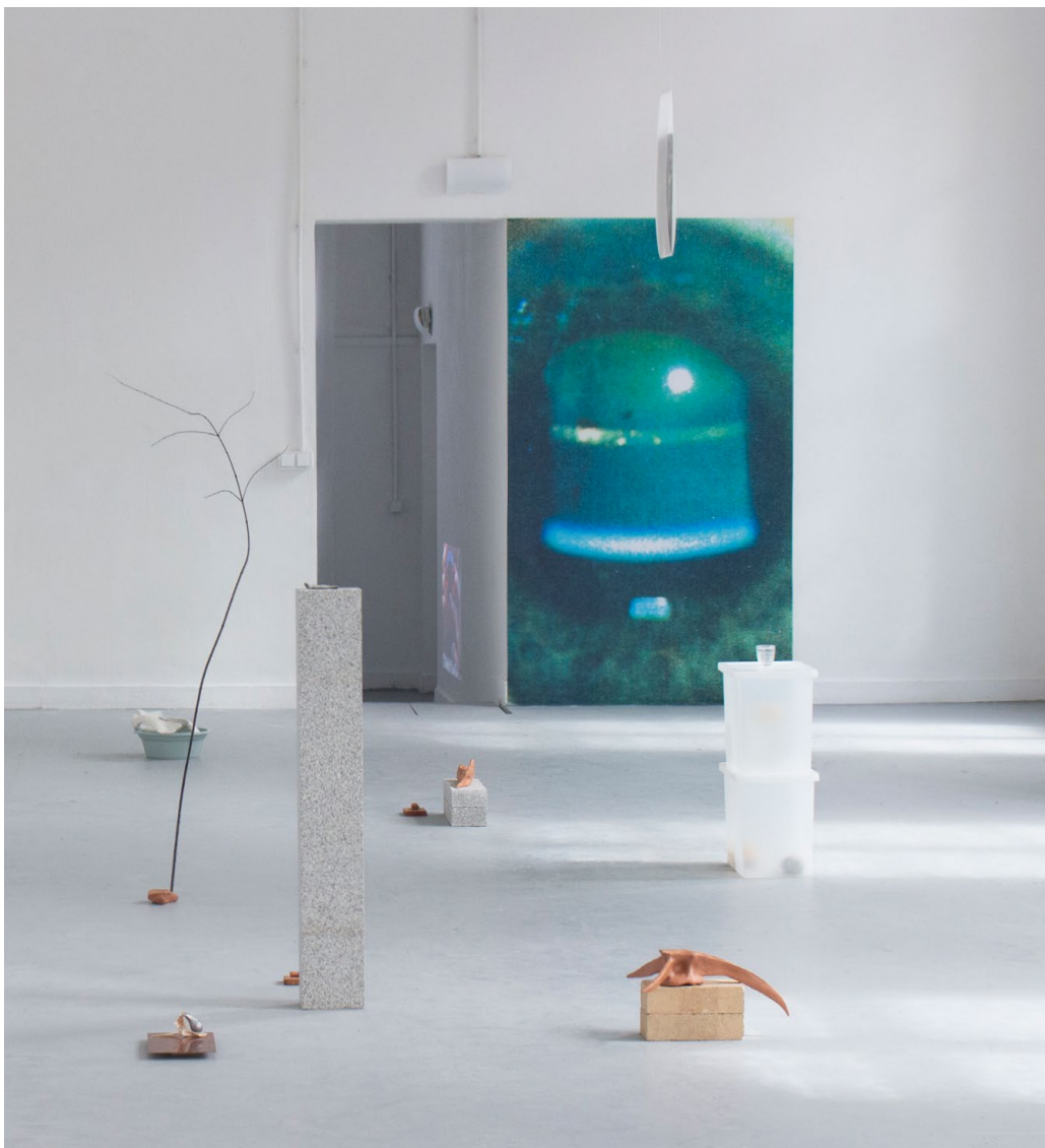
orbes, 2021 ↑ vue de l'installation

DNSAP Ecole Nationale Supérieure des Beaux-arts de Paris, Atelier Janssens.