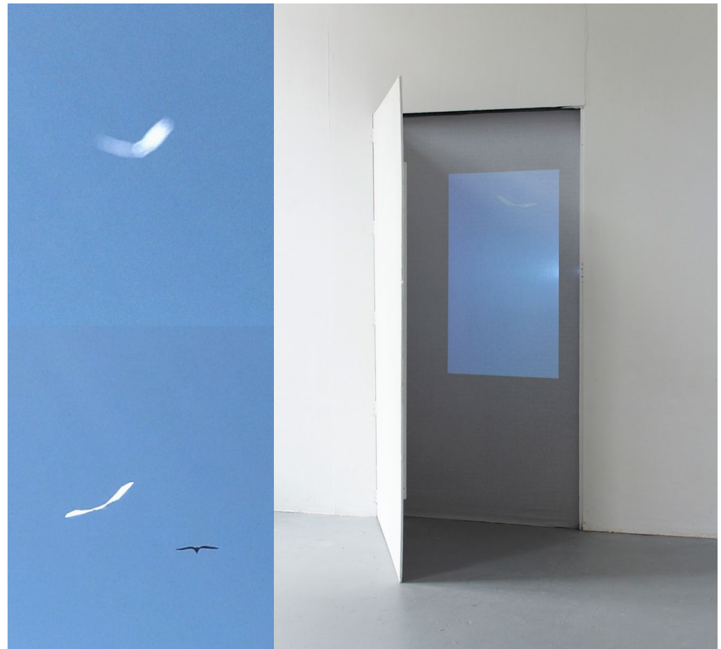
ce n'est pas un oiseau, 2021 ↑ photogramme.