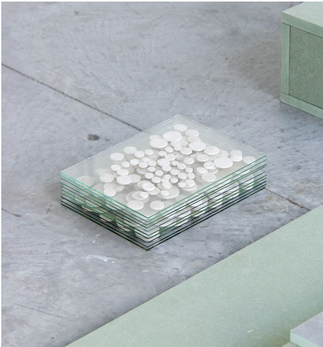
numismatique, 2024 ↑ plâtre, verre. 25 x 20 x 6 cm.

Mise en tas de reproduction en plâtre de pièces de monnaie de collection.