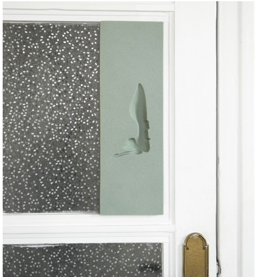
forme étudiée 02, 2023 ← mâchoire de tortue luth, Newton-mètre. 20,5x2,4x12 cm.