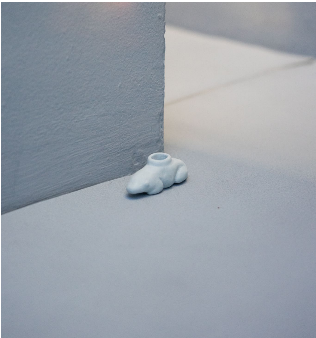
grenouille soliflore, 2023 ↑ faïence, 2,5 x 6 x 3 cm.

Reproduction par le modelage d'une pièce antique de la collection du musée d'archéologie d'Athènes.