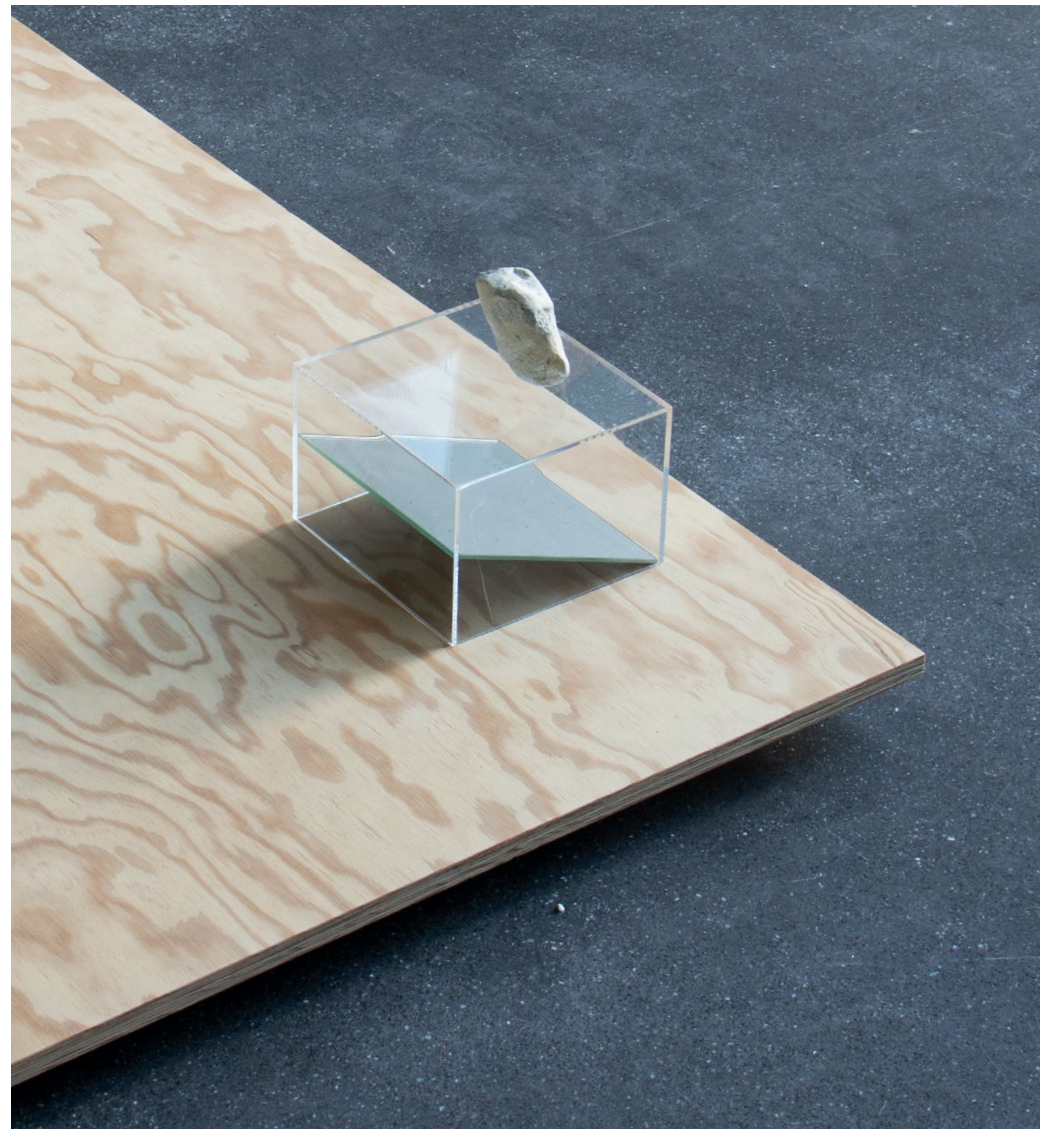
étendue 02 - pieds, (vue 3), 2023 ← plâtre. 32x40x65 cm

Reproduction en plâtre d'une pièce de la collection du musée d'archéologie d'Athènes. Il arrive souvent que, d'une sculpture antique d'un modèle humain, il ne reste que les pieds ancrés dans un socle de pierre.