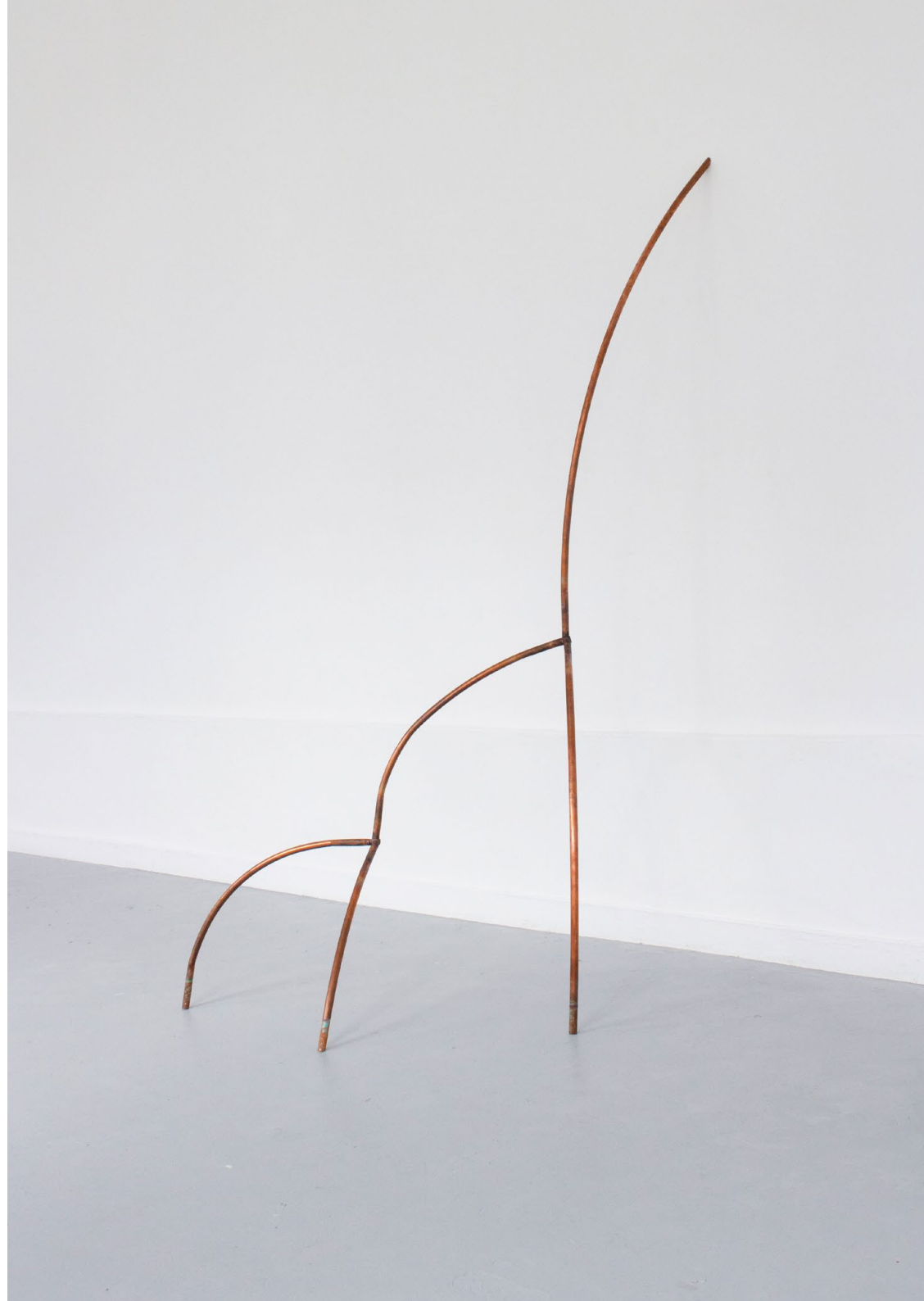
pneumatophore, 2021 → cuivre, eau, sel, citron, vinaigre. 252 x 120 x 74 cm.

DNSAP Ecole Nationale Supérieure des Beaux-arts de Paris, Atelier Janssens.