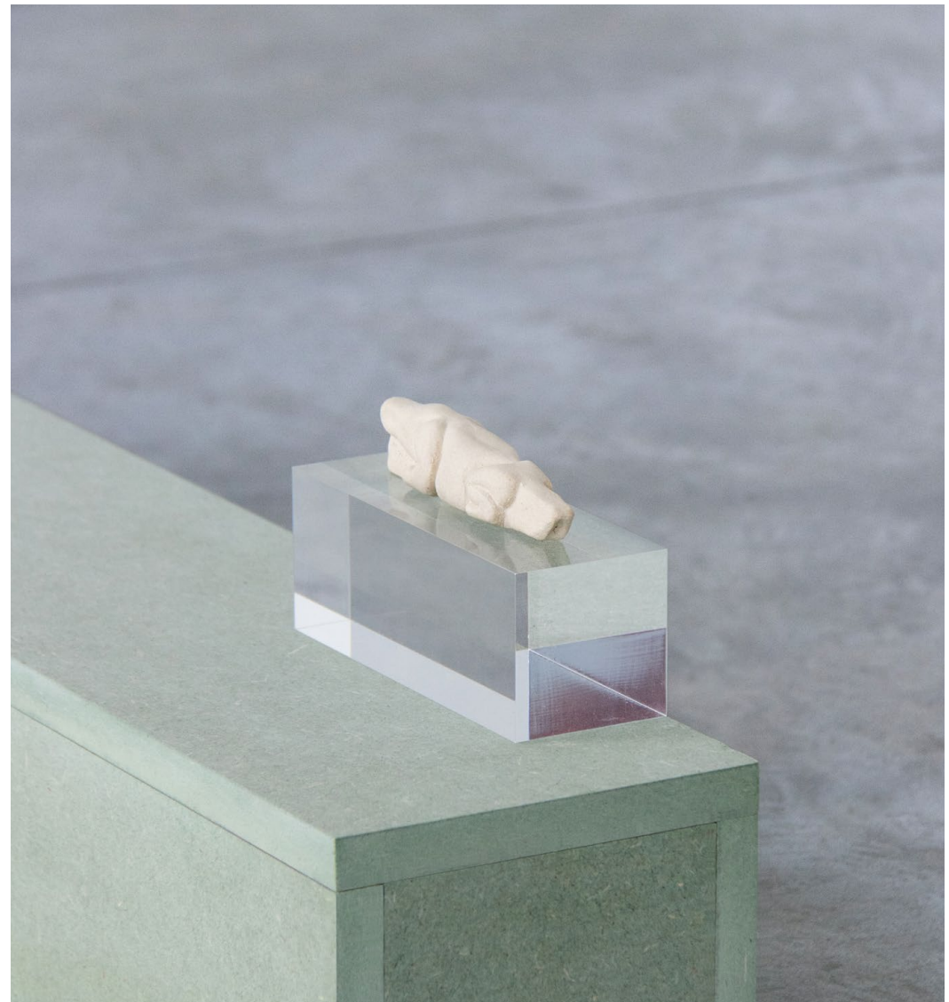
amulette, 2024 ↑ grès, plexiglas. 18 x 8 x 5 cm

Mise en tas de reproduction en plâtre de pièces de monnaie de collection.